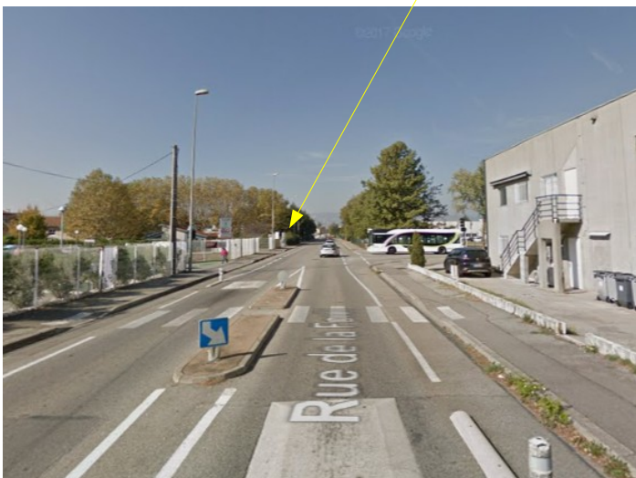
Arrivée depuis le centre-ville :