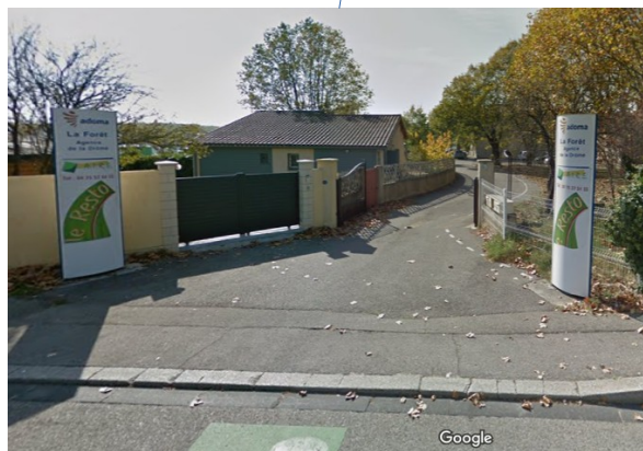
Arrivée depuis le périphérique :